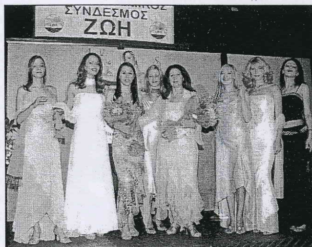
Από την επίδειξη μόδας στις 11.5.2003 στο Hilton Park