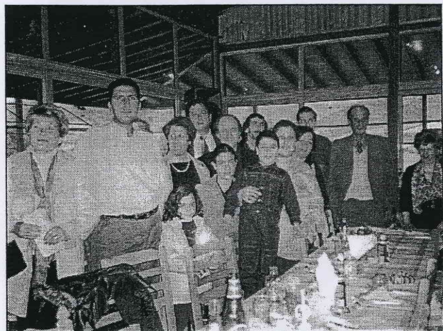
Από τη συνενστίαιση στη Χοιροκοιτία στις 2.3.2003.

Μέλος στο Σύνδεσμο μπορεί να γίνει οποιοσδήποτε, αφού συμπληρώσει ένα έντυπο και καταβάλλει συνδρομή £5 το χρόνο. Οι ασθενείς (που πάσχουν από αιματολογικά προβλήματα) απαλλάσσονται από τη συνδρομή. Πρέπει όμως να συμπληρώσουν το σχετικό έντυπο.