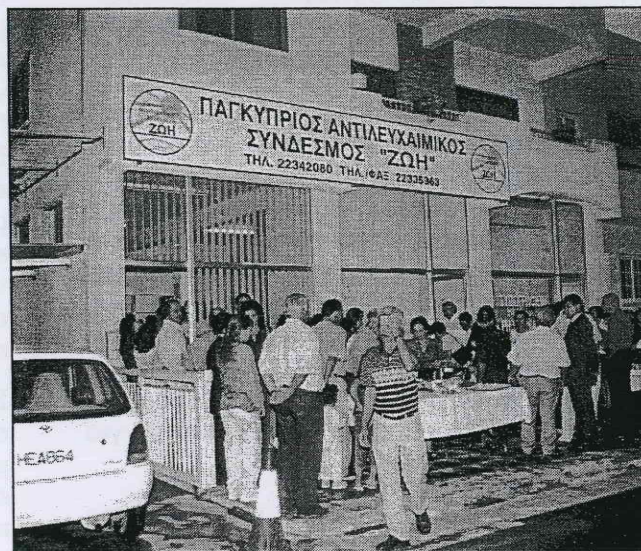
Από την εκδήλωση για την επίσημη έναρξη της δράσης του.