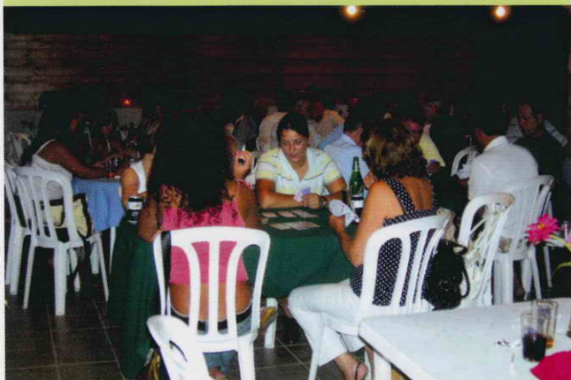
Από το διαγωνισμό Κουρκάν.

Η οργάνωση και καταμερισμός ευθυνών έγινε και έφτασε η μέρα της πραγματοποίησης. Τετάρτη 5 Σεπτεμβρίου 2007 η 1η μέρα. Θα ρθουν "αθλητές" θα πετύχουμε; Το ένα ερώτημα. Το άλλο, λίγο πιο βασανιστικό. Θα τα καταφέρουμε στα σουβλάκια και γενικά στην περιποίηση όσων παραστούν;