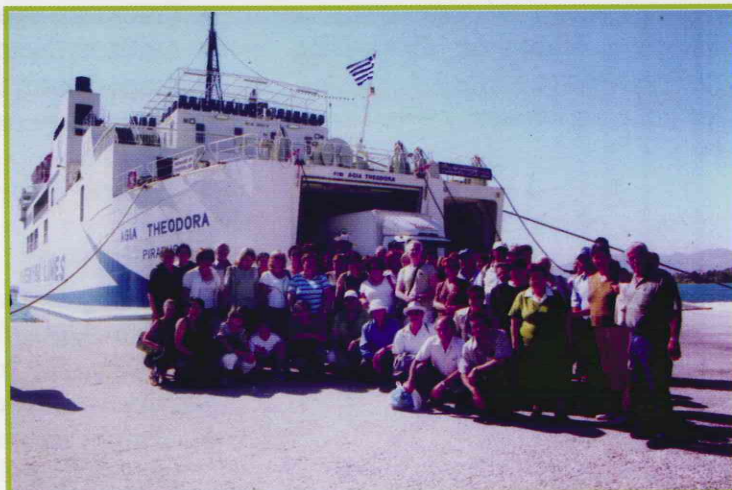
5 η Εκδρομή στην Ελλάδα (4-10/7/2007) Οι εκδρομείς έτοιμοι για μια επίσκεψη στην Κέρκυρα.

Είναι το τελευταίο αποκούμπι του πάσχοντος συνανθρώπου μας.