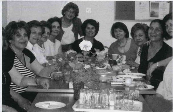
Από την επίσκεψη φίλων και υποστηρικτών στο οίκημα του Συνδέσμου.