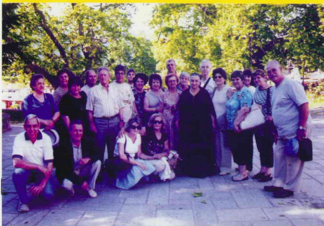
Μέτσοβο. Φωτογραφία με μια κυρία του Μετσόβου με τοπική ενδυμασία

Τη Δευτέρα 9 Ιουλίου πραγματοποιήθηκε μονοήμερη εκδρομή στις Σέρρες. Επισκεφτήκαμε τα σπήλαια Αλιστράτης, προσκυνήσαμε στο μοναστήρι του Τιμίου Προδρόμου και πήραμε το γεύμα στον Άγιο Ιωάννη.