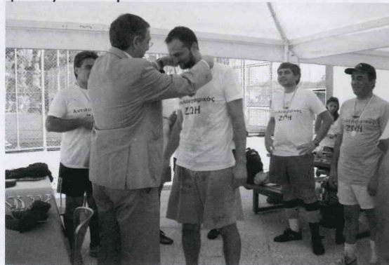
Ο Υπουργός Υγείας κ. Κ.Καδής απονέμει τα έπαθλα στο 2ο Τουρνουά μίνι ποδοσφαίρου.

Δήλωσαν συμμετοχή και διαγωνίστηκαν συνολικά 23 ομάδες. Νικήτρια αναδείχτηκε η ομάδα από τον Αγρό "Αχιλλέας" που την αποτελούσαν: