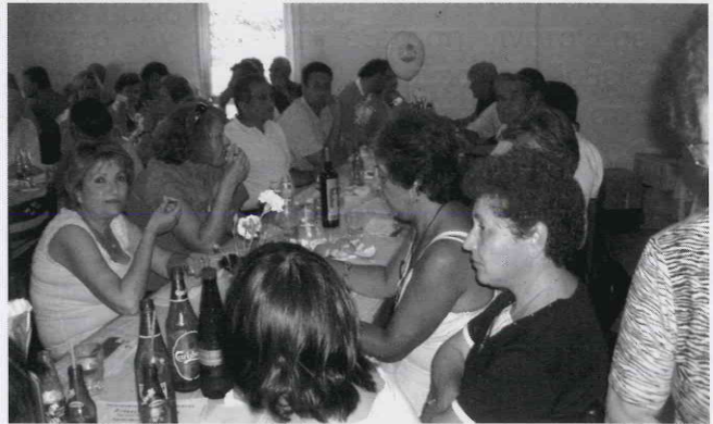
Από τη Συνεστίαση στις 20.5.07.

Εκτός από τις κληρώσεις δεν μπορούσε να λείπει και η μουσική και φυσικά ο χορός. Πολλοί και πολλές (ιδίως πολλές) έδειξαν τις χορευτικές τους ικανότητες.