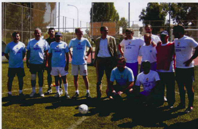
Η ομάδα των Βουλευτών με την ομάδα του Αντιλευχαιμικού στο 2 ο Τουρνουά μίνι ποδοσφαίρου μαζί με τον Υπουργό.

Με την ευκαιρία αυτή ευχαριστούμε τη Διεύθυνση, το ιατρικό και νοσηλευτικό προσωπικό της κλινικής για τη συνεργασία τους και διαβεβαιώνουμε ότι θα μας βρίσκουν συμπαραστάτες τους σε κάθε περίπτωση.