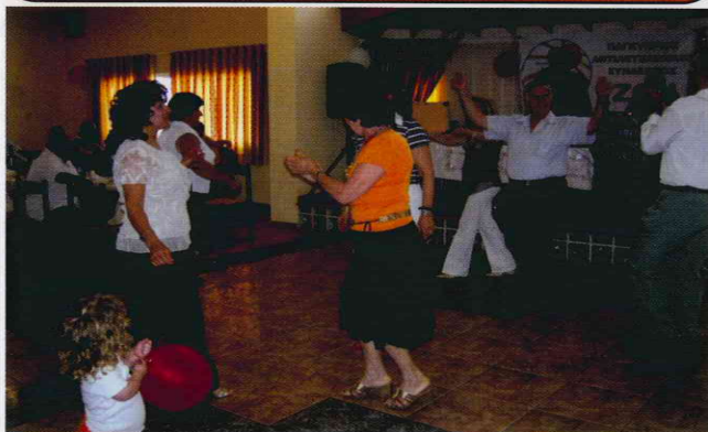
Συνεστίαση, Απαραίτητος ο χορός.