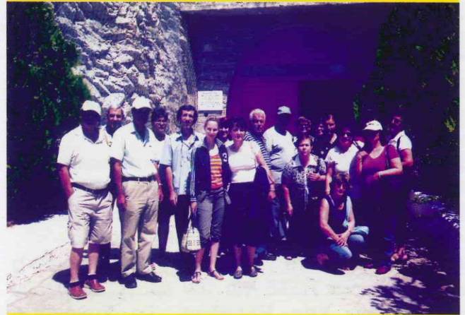
Μια φωτογραφία στην είσοδο των σπηλαίων της Αλιστράτης.

Τρίτη 10 Ιουλίου. Τελευταία μέρα. Πρωινό ελεύθερο για τα απαραίτητα ψώνια. Το απόγευμα ξενάγηση στην πόλη της Θεσ/νίκης και επίσκεψη στη Σουρωτή. Προσκύνημα στον Άγιο Ιωάννη Θεολόγο όπου και ο τάφος του πατρός Παϊσίου. Φαγητό στην παραλία και στις 9:30 μ.μ. άφιξη στο αεροδρόμιο για επιστροφή. Η πτήση προγραμματισμένη για τα μεσάνυχτα (00:10').