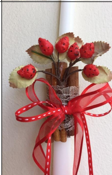
Λαμπάδες με κανέλλα