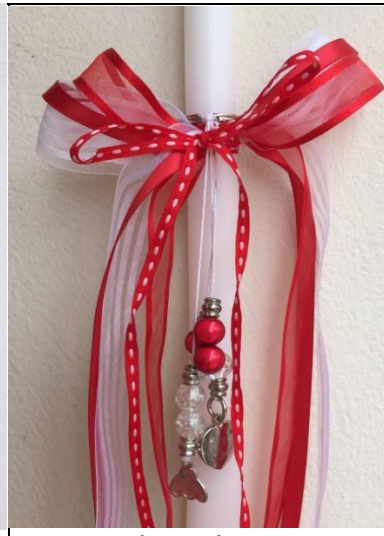
Μπρελόκ με χάντρες και καρδούλες