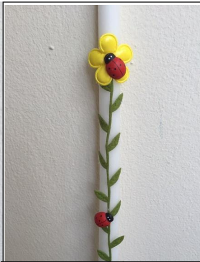
Ανάλογα με τη διαθεσιμότητα των υλικών θα παραδίδεται το ένα ή το άλλο είδος